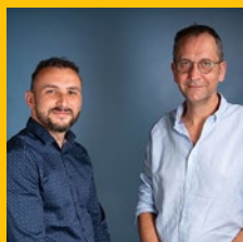
PRIX REPRISE EMPREINTE DIGITALE