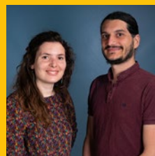
PRIX DU JURY et PRIX COUP DE CŒUR DU PUBLIC P'TITS POIDS CAROTTES