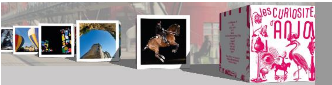
Visuel non contractuel : Photomontage

Aux abords de la toue, grâce à des cubes géants de 2x2m (avec 4 faces de visuels sur chaque cube) l'Anjou sera décliné sous la forme d'une exposition-photos autour des 6 thématiques curieuses. Les pommes tapées, la boule de fort, la tradition équestre du Cadre noir, les troglodytes et autres richesses patrimoniales de l'Anjou seront à l'honneur.