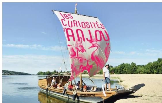
Visuel non contractuel : Photomontage