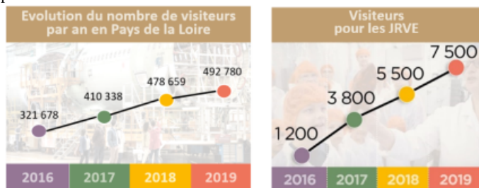
Graphiques 3 et 4 illustrant l'évolution du nombre de visiteurs dans les entreprises dans Pays de la Loire et l'évolution du nombre de visiteurs enregistrés lors des JRVE.

Dans la région Pays de la Loire, ce sont plus de 490 000 visiteurs qui ont poussé les portes des entreprises ligériennes en 2019. Un engouement qui s'est une nouvelle fois mesuré lors des 4 ème Journées Régionales de la Visite d'Entreprise puisque ce sont plus de 7500 visiteurs qui ont pu bénéficier d'un programme de visites variées, innovantes et instructives. Une nouvelle forme de tourisme qui séduit la curiosité de multiples publics transgénérationnels : particuliers ou groupes, jeunes ou adultes, locaux ou vacanciers, la visite d'entreprise permet d'apprendre, de mieux comprendre et peut susciter des vocations tout en contribuant à l'éducation des enfants !