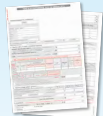
Bordereau ≥ à 250 salariés

En 2011, près de 13 000 entreprises des Pays de la Loire ont fait confiance à leur CCI pour traiter leur taxe d'apprentissage. Elles ont ainsi bénéficié d'un accompagnement personnalisé et d'une expertise avérée. La taxe d'apprentissage contribue à investir sur les hommes, leurs qualifications, la formation étant un des leviers majeurs de la compétitivité régionale.